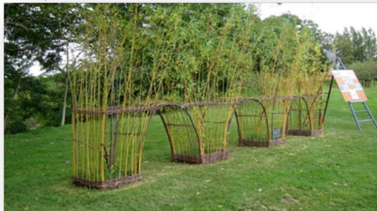
Représentation stylisée en osier vivant du viaduc de Chabenet

En septembre 2011, l'association a financé et organisé une manifestation de vannerie européenne qui a attiré plusieurs milliers de visiteurs.